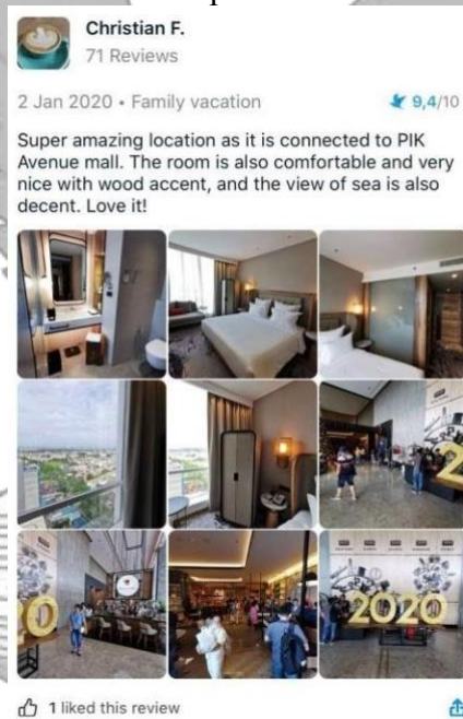
GAMBER 3 Contoh Ulasan Tamu pada Situs Traveloka 2020

berbasis online di wilayah Asia Tenggara. Traveloka juga memiliki daftar akomodasi bervariasi yang dapat dipesan secara langsung mulai dari hotel, apartemen, wisma, homestay , hingga villa dan juga resor. Aplikasi seluler Traveloka telah diunduh sebanyak lebih dari 30 juta kali dan menjadikannya aplikasi pemesanan perjalanan dan akomodasi paling populer di wilayahnya. Selain dapat memesan dan merencanakan perjalanan secara langsung, Traveloka juga menyediakan fitur ulasan yang dapat membantu para penggunanya dalam merencanakan perjalanan wisatanya (Traveloka, 2020).