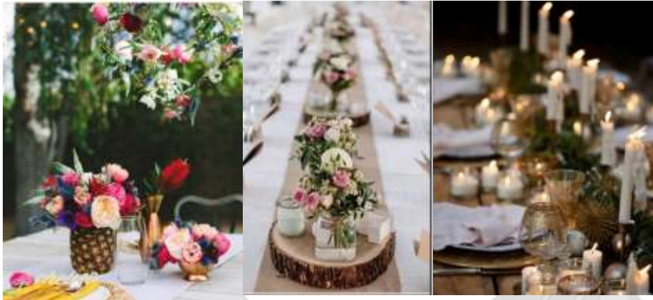
Gambar 1.2.2 Contoh Dekorasi Musim Panas