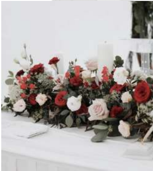
Gambar 1.2.5 Contoh Dekorasi Pernikahan, Dekorasi Wedding Pertama Baletón Decoration di Chakra, BSD