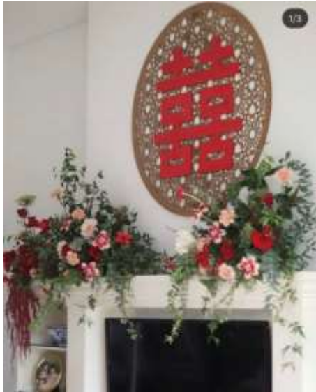
Gambar 1.2.6 Contoh Dekorasi Sangjit