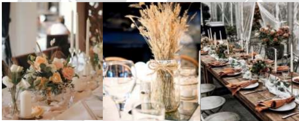
Gambar 1.2.1 Contoh Dekorasi Musim Gugur