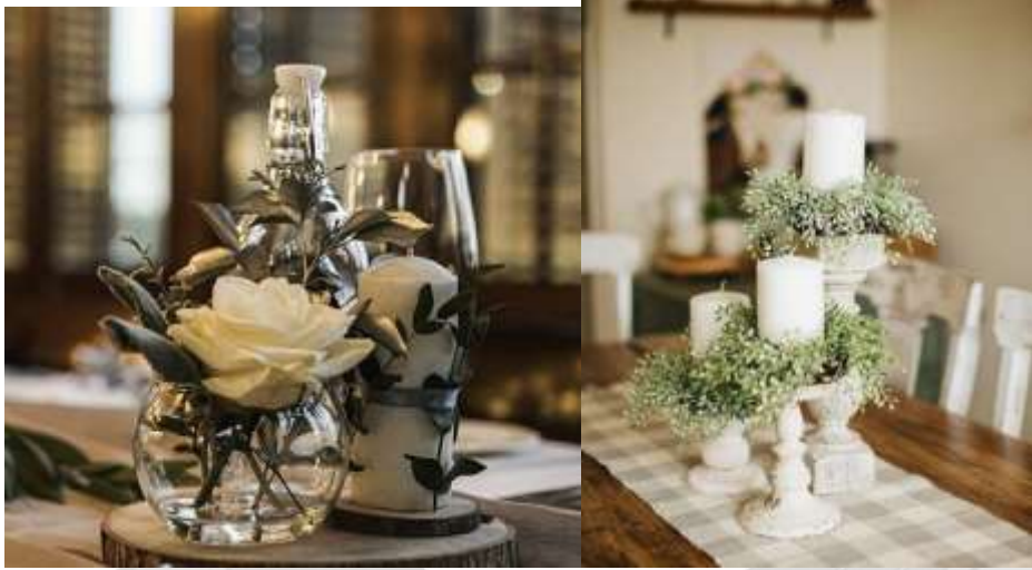
Gambar 1.2.4 Contoh Dekorasi Musim Semi