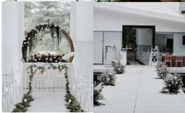
Gambar 1.2.3 Contoh Dekorasi Musim Dingin