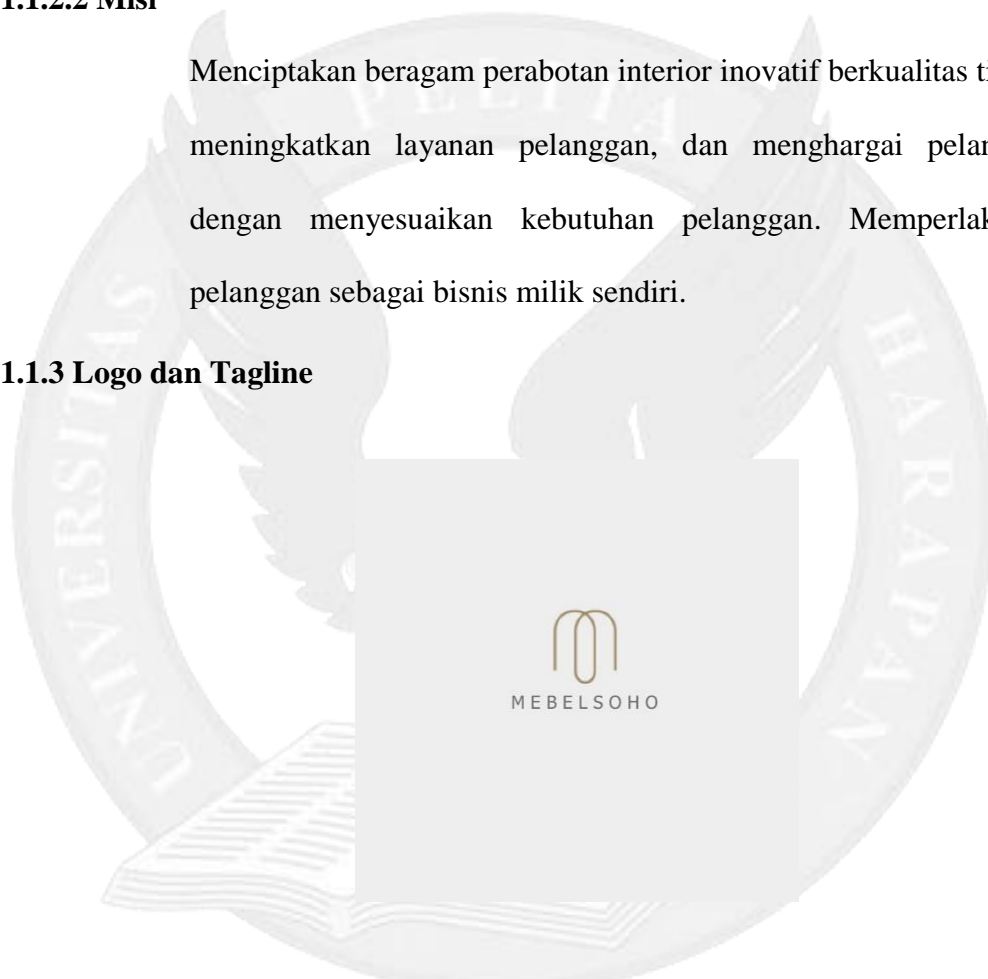
Gambar 1.1 Logo MebelSoho