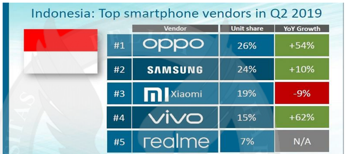
Gambar 1.3 Lima Ponsel Pintar Terbaik di Indonesia Tahun 2019

(Gambar 1.2). Bahkan iPhone sendiri tidak masuk dalam lima ponsel pintar terbaik di Indonesia pada tahun 2019 (Gambar 1.3). Dibawah diberikan data lima ponsel pintar terbaik di Indonesia tahun 2019: