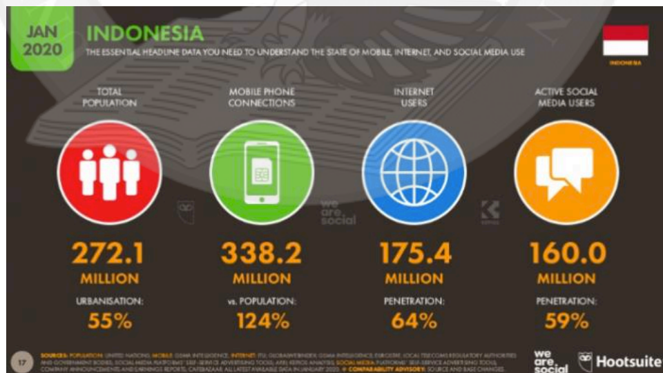
Gambar 1.1 Data Pengguna Ponsel dan Internet di Indonesia Januari 2020

Salah satu produk yang sering dicari informasinya sebelum melakukan pembelian adalah smartphone . Seperti yang kita ketahui bahwa belakangan ini era teknologi dan digital sangat berkembang pesat dimana mau tidak mau semua orang harus menyesuaikan diri dengan perkembangan tersebut. Termasuk smartphone yang sekarang menjadi sebuah kebutuhan bagi semua orang. Smartphone digunakan banyak orang mulai dari berkomunikasi, mencari hiburan, berbelanja, sarana pendidikan dan mencari informasi hingga melakukan pembayaran dan sejumlah transaksi. Gambar berikut memperlihatkan jumlah data pengguna ponsel dan internet di Indonesia di Januari 2020: