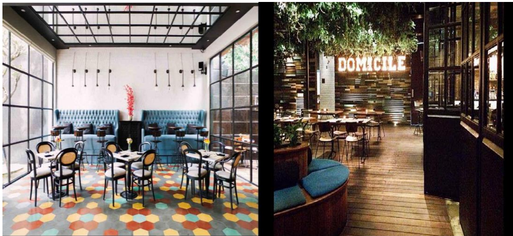
Gambar 1.5 : Atmospherics di Domicile Kitchen & Lounge Surabaya

pelanggan. Waiter/waitress juga berpenampilan rapi dan bersih. Pelayan Domicile Kitchen & Lounge Surabaya cepat dan professional. Secara keseluruhan, kualitas pelayanan di Domicile Kitchen & Lounge Surabaya sangatlah baik.