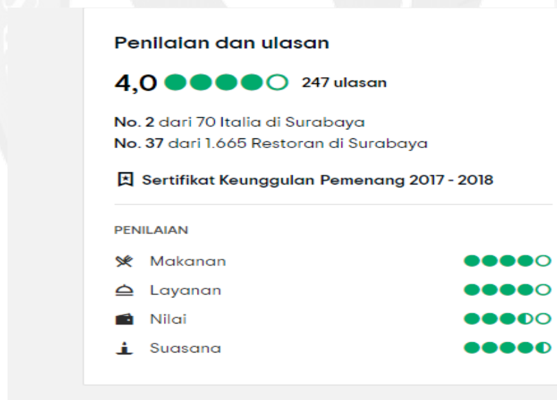
Gambar 1.1 Rating yang diberikan oleh Pelanggan Domicile Kitchen & Lounge di Surabaya

Domicile Kitchen and Lounge Surabaya merupakan restoran yang dibuka pada tanggal 21 Januari 2014 dan beralamat di Jl. Sumatra No 35, Jawa Timur 60281. Restoran Domicile Kitchen & Lounge adalah salah satu restoran fine dining yang memiliki rating yang sangat bagus dengan nilai 4 dari 5 dengan perincian di gambar 1.1