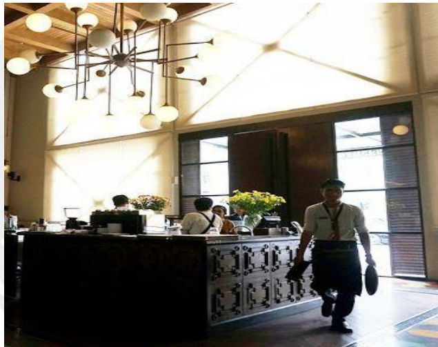
Gambar 1.4 : Service Quality Domicile Kitchen & Lounge di Surabaya

Domicile Kitchen & Lounge di Surabaya punya skor 4 dari 5 ini menunjukkan kepuasan pelanggan terhadap food quality yang di berikan Domicile Kitchen & Lounge di Surabaya kepada pelanggan.