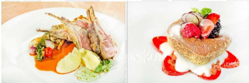
Gambar 1.3 : Makanan di Domicile Kitchen & Lounge di Surabaya

Menurut (Rachmawati, 2009) Positive emotion cenderung menghasilkan sikap yang positif bagi konsumen misalnya konsumen menjadi tertarik pada suatu produk atau promosi. Emosi dapat mempengaruhi suasana hati seseorang. Emosi juga menjadi salah satu faktor yang penting dalam pengambilan keputusan oleh konsumen. Emosi dapat dibagi menjadi dua yaitu emosi positif dan emosi negatif. Contoh emosi positif misalnya bahagia, senang, bersemangat, damai. Ini dibuktikan melalui pelanggan yang terlihat senang dan menikmati suasana yang ada di Domicile Kitchen & Lounge di Surabaya. Ini juga bisa dibuktikan dengan review yang diberikan pada gambar 1.2 dimana pelanggan merasa sangat senang berada di Domicile Kitchen & Lounge di Surabaya.