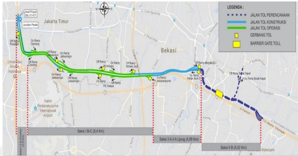
Gambar 4. Peta Keseluruhan Seksi IA-Seksi IIB Jalan Tol Becakayu