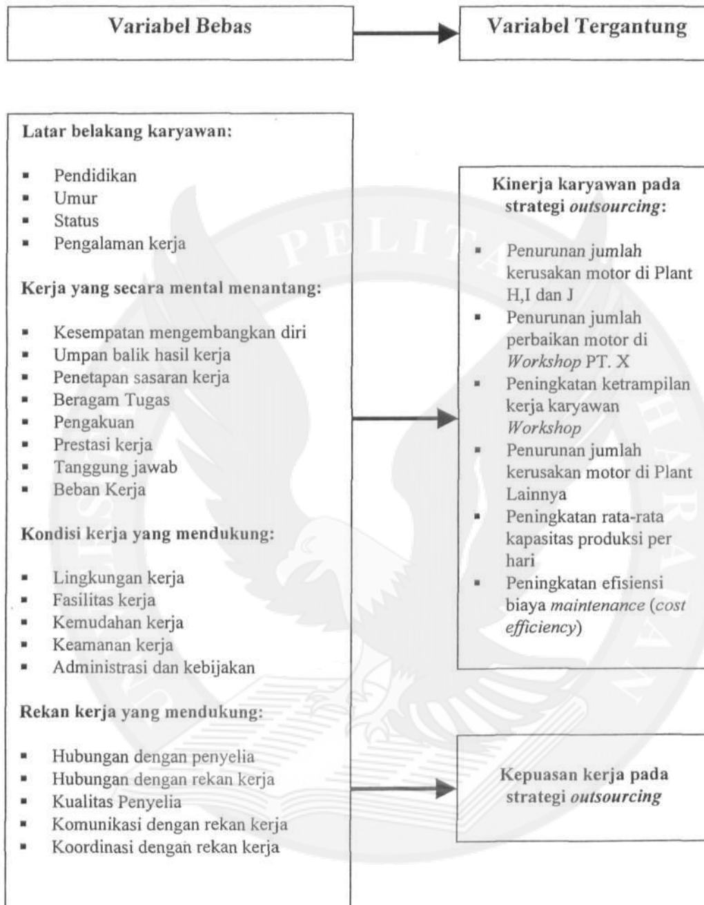
Gambar 1 Kerangka Hubungan Outsourcing - Kinerja dan Kepuasan Kerja