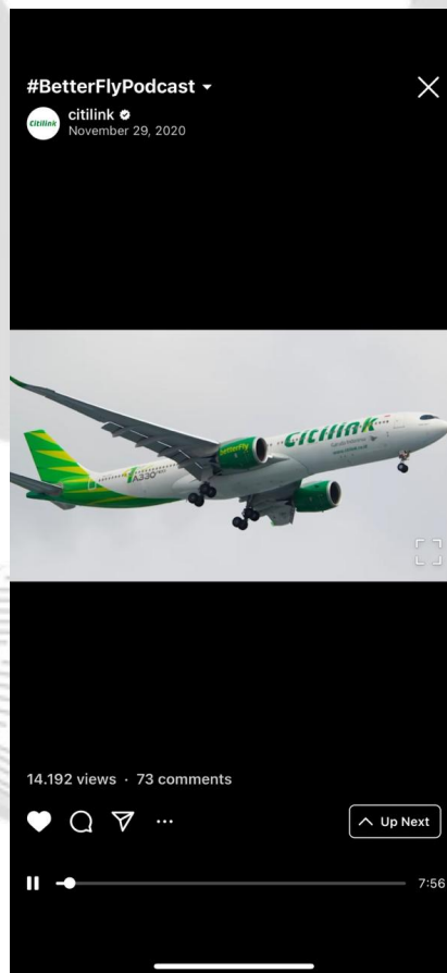
Gambar 1.3 Podcast Citilink di tengah pandemi COVID-19

Divisi Marketing Communication Citilink bahkan melakukan cara – cara komunikasi yang kreatif untuk mendukung kegiatan promosi perusahaan. Salah satunya adalah penggunaan Podcast di aplikasi Spotify. Berikut adalah contoh dari kegiatan Podcast yang dilakukan Divisi Marketing Communication Citilink: