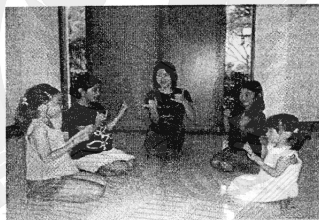
Gambar 1. Hand Playing

Kemudian ada satu lagi ciri khas yaitu permainan tangan ( hand playing ). Kita bermain dengan memakai lengan, tangan dan jari-jari mengikuti irama musik. Tanpa terasa anak-anak akan dapat menggerakkan jari jemarinya lebih terampil dan bervariasi. Ini disebut tingkat persiapan untuk menggunakan gerakan jari jemari dan lagipula ini juga bermanfaat untuk melatih otot-otot lengan dan tangan yang jarang dipakai dalam kehidupan sehari-hari. Permainan tradisional (permainan menggerakkan tubuh sambil mendengarkan bunyi) adalah salah satu bentuk dasar eurhythmics .