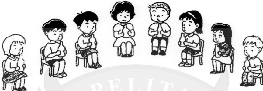
Gambar 4. botol di tiup oleh masing-masing anak

Waktu menerangkan bagaimana terjadinya suara saya memakai alat-alat peraga. Seperti tampak pada foto 3, dengan gelas yang diisi air, berdasar banyaknya air kita bisa membuat bunyi yang berbeda-beda. Foto 4, menunjukkan dengan bola yang berbeda-beda besarnya kita bisa membuat bunyi yang berbeda-beda pula.