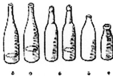
Gambar 3. Botol diisi air