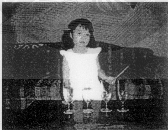
Gambar 5 Glass Bell

Dengan begitu anak-anak bisa memahami bagaimana bunyi bisa dibuat dan apa itu interval; Anak-anak akan terbiasa dengan suara dan merasa senang waktu belajar musik. Selain itu kita juga membuat alat-alat musik dengan bahan-bahan yang ada di sekitar kita lalu memainkannya.