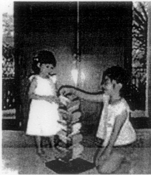
Gambar 6 Wood Sound Test