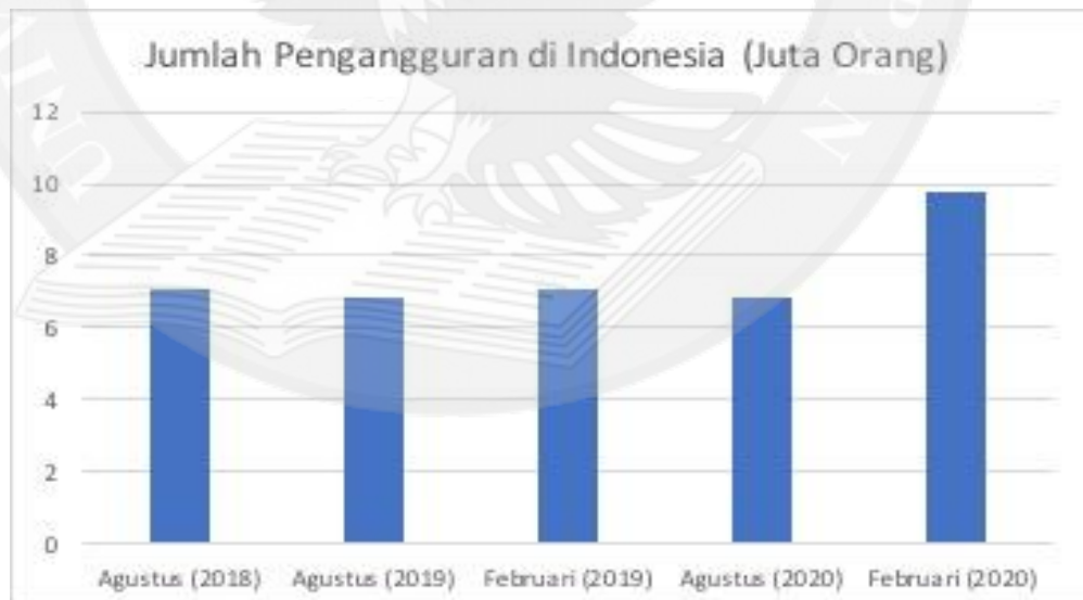
Gambar 1.1 Jumlah Pengangguran di Indonesia

Permasalahan ekonomi menjadi salah satu permasalahan yang sering terjadi di banyak negara. Masalah yang terjadi telah berkaitan dengan faktor kesenjangan ekonomi, dan juga pengangguran. Sehingga Indonesia terus mengalami masalah pengangguran atau kekurangan lapangan pekerjaan.