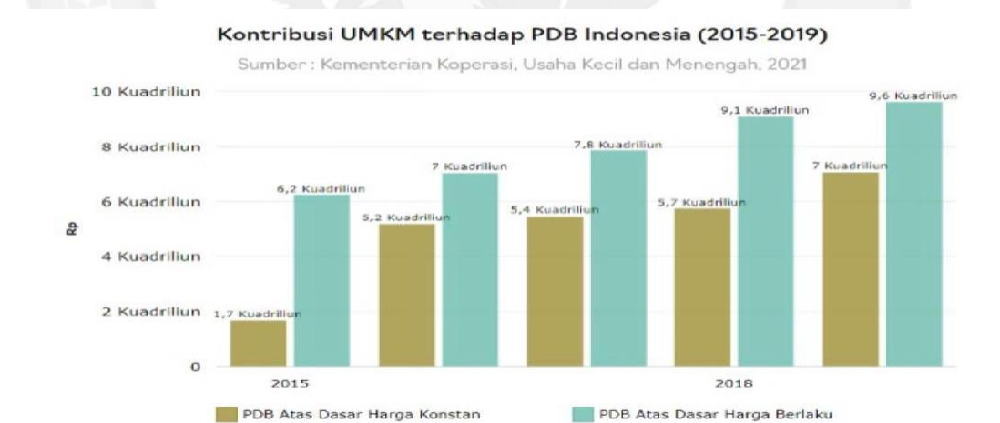
Gambar 1.2 Kontribusi UMKM terhadap PDB Indonesia

Tranformasi digital yang semakin maju didorong juga karena adanya pandemi Covid- 19 ini. Transaksi yang mengalami kenaikan tertinggi tercatat berasal dari data transaksi digital E-Commerce yang meningkat tajam pada Kuartal 1-2021. Transaksi digital yang meningkat ini dapat dilihat dari transaksi yang jumlahnya mencapai 548.000.000 transaksi dan nominal hingga sekitar Rp 88 Triliun. selain itu berdasarkan data statistik peningkatan jumlah transaksi yang tercatat mencapai hamper 99 persen dibanding periode tahun sebelumnya, Sedangkan jumlah nominal transaksinya hingga mencapai 52 persen disbanding periode yang sama ditahun sebelumnya (Octaviano , 2021). Beberapa ahli bahkan menyatakan bahwa kedepannya transaksi digital akan menjadi new normal bagi masyarakat dikarenakan ketidakpastiaan global akibat pandemi Covid-19. Hal ini sama dari penelitian yang telah dilakukan oleh (Hashem, 2020), bahwa dimasa depan setelah pandemi berbelanja secara daring akan menjadi kebiasaan baru bagi masyarakat karena dapat menawarkan efisiensi bagi para penggunannya