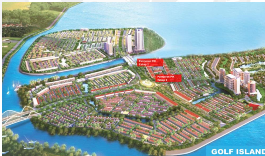
GAMBAR 2 Lokasi Pantjoran PIK Extension

kawasan Golf Island hanya baru terdapat 5 restoran yaitu: Wing heng, My star, Dim Sum central, Suji-suan, hollywings 24, untuk di Pantjoran PIK sendiri hanya baru terdapat 2 restoran Dimsum yaitu May Star dan Din Tai Fung. Dikarenakan Pantjoran PIK tahap pertama sudah terisi semua sehingga memiliki banyak peminat dan juga pengunjung dengan adanya hal ini membuat Agung Sedayu Group memperluas Pantjoran PIK menjadi tahap ke dua, dan berhubung di Pantjoran PIK Extension belum ada penyewa yang berminat untuk menjual makanan sejenis Dimsum, sehingga dengan adanya hal ini membuat penulis bertekad untuk membangun bisnis yang berlokasi di Pantjoran PIK Extension, Pantai Maju Golf Island, Pantai Indah Kapuk, dan berikut ini adalah denah gambar lokasi Pantjoran PIK.