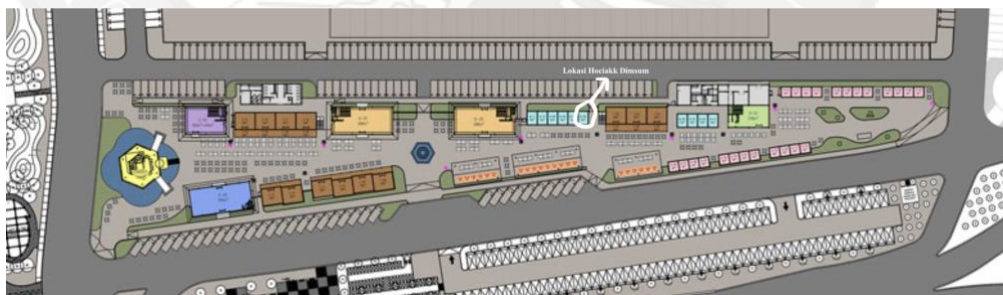
GAMBAR 4 Lokasi Tenant Hociakk Dimsum

akan menghadirkan rasa dimsum yang authentic dan kualitas akan terjamin baik, dan juga kualitas yang akan diberikan untuk setiap pelanggan, restoran kami dirancang dengan sedemikian rupa agar setiap pengunjung yang berdatangan akan merasa nyaman untuk bersantap sambil berdiskusi, Layanan Dine – In akan mematuhi protokol kesehatan dengan pemberlakuan maksimum 50% dari kapasitas restoran dan batas waktu untuk makan ditempat yaitu 60 menit. Tipe restoran untuk Hociakk Dimsum sendiri adalah Ethnic Restaurant karena tema dari restoran Hociakk sendiri adalah China kuno. Menu yang akan ditawarkan oleh Hociakk Dimsum adalah menu à la carte dan untuk jenis layanan yang digunakan adalah Single Point Service , yang dimana para pelanggan akan dilayani oleh karyawan Hociakk pada saat ingin memesan atau juga bisa memesan melalui aplikasi yang telah kami sediakan, dan pengambilan makanan bisa diambil di bagian Pick-Up area .