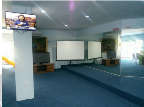
Sentra Audio Visual