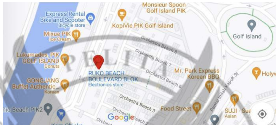
GAMBAR 3 Peta Lokasi Ruko Beach Boulevard, Golf Island

PT. Kapuk Niaga Indah yang merupakan anak perusahaan dari PT. Agung Sedayu Group.