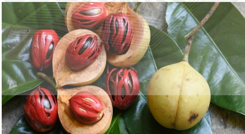
GAMBAR 1 Tanaman Pala

Indonesia adalah negara yang kaya akan buah eksotis seperti pala, cempedak, belimbing, manggis, salak dan gandaria. Buah-buah eksotis ini sangat banyak kita temui di daerah Maluku. Pala dalam bahasa binominal ( myristica fragrans ) merupakan tumbuhan berupa pohon yang bersumber dari kepulauan Banda, Nodaku. Buah pala sendiri terdiri dari 78% daging dan 17% biji yang dimana biji pala sendiri mempunyai nilai ekonomi yang cukup tinggi karena dapat dimanfaatkan sebagai minyak pala (Alegantina, 2018). Dampak nilainya yang tinggi sebagai rempah-rempah, buah dan biji pala telah dijadikan komoditi perdagangan yang penting sejak masa Romawi (Kakerissa, 2018).