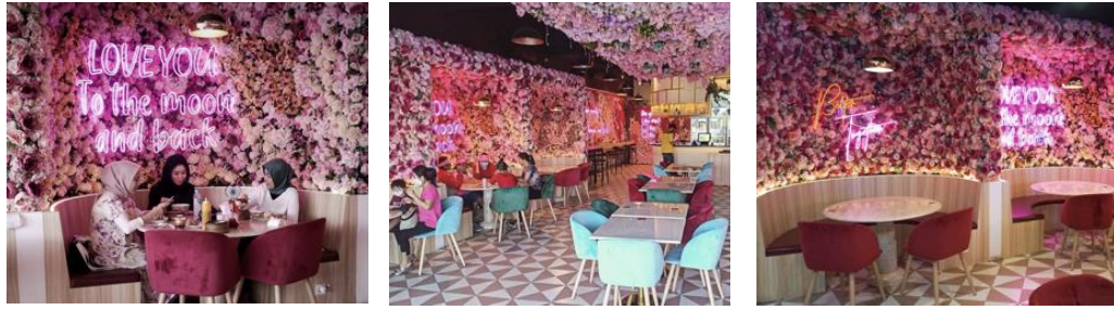
Gambar 1.1. Suasana Restoran Wang Fu Dimsum

Wang Fu Dimsum adalah sebuah restoran berlokasi di BSD City, Tangerang Selatan yang menyajikan berbagai makanan dengan cita rasa yang baik, halal, secara khusus makanan dengan jenis “Dimsum”. Dimsum yang memiliki arti menyentuh hati dalam Bahasa Mandarin, adalah sebuah hidangan tradisional negara Cina yang terdiri dari beberapa jenis makanan dengan ukuran yang relatif kecil. Hidangan makanan dim sum di antaranya adalah seperti bakpao, pangsit goreng ( dumpling ), hakau, pangsit kukus ( gyoza ), ceker ayam ( fung zau ), dan lain-lain.