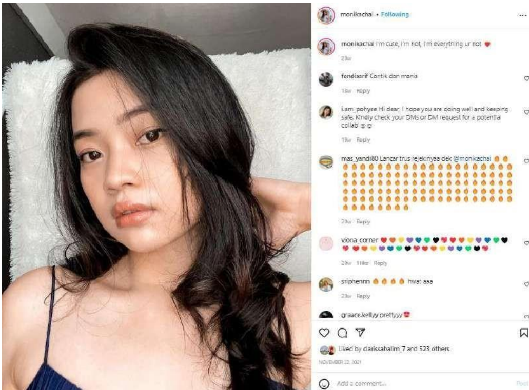
Gambar 1.4. Tampilan Instagram Parasocial Interaction Monikachai dengan Pengikut