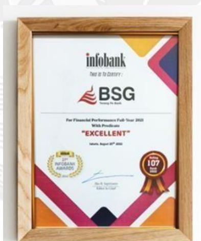
Gambar 1.5 Bank SulutGo menerima Infobank Award 2022