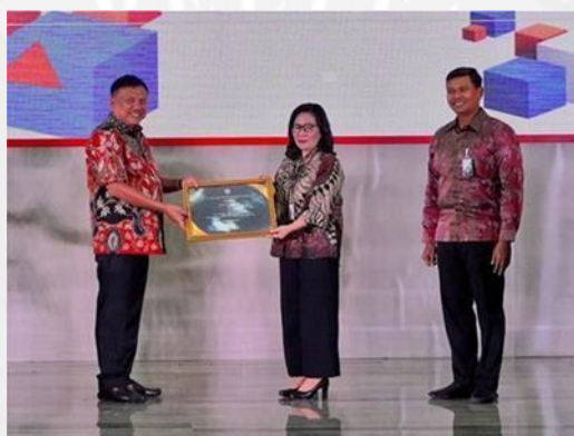
Gambar 1.4 Bank SulutGo menerima Paritrana Award 2022