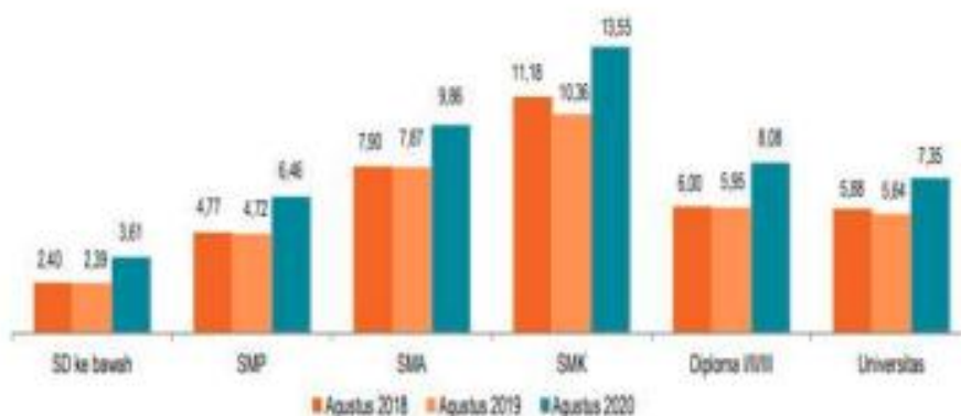
Gambar 1.3 Tingkat Pengangguran Terbuka (TPT) Menurut Pendidikan Tertinggi yang Ditamatkan (persen), Agustus 2018–Agustus 2020

Data Badan Pusat Statistik (BPS) melaporkan bahwa Tingkat Pengangguran Terbuka (TPT) menurut pendidikan tertinggi yang diselesaikan di Indonesia dari tahun 2018 hingga 2020 adalah lulusan minimal SD ke bawah, yaitu sekitar 3%, disusul oleh Sekolah Menengah Atas (SMP) sekitar 5%. Pengangguran tingkat Sekolah Menengah Atas (SMA) meningkat pada tahun 2020 menjadi 9,86%, sedangkan untuk Sekolah Menengah Kejuruan (SMK) sebanyak 13,55%. Tidak sebanyak jenjang SMA dan SMK, jumlah pengangguran untuk siswa SMK tahun 2020 adalah 8,8% dan untuk perguruan tinggi 7,35%. Dengan demikian dapat dikatakan bahwa lamaran SMK merupakan jumlah lamaran terbanyak untuk lulusan SD, SMP, Diploma dan Perguruan Tinggi. Jumlah total data di Indonesia digambarkan pada Gambar 1.3.