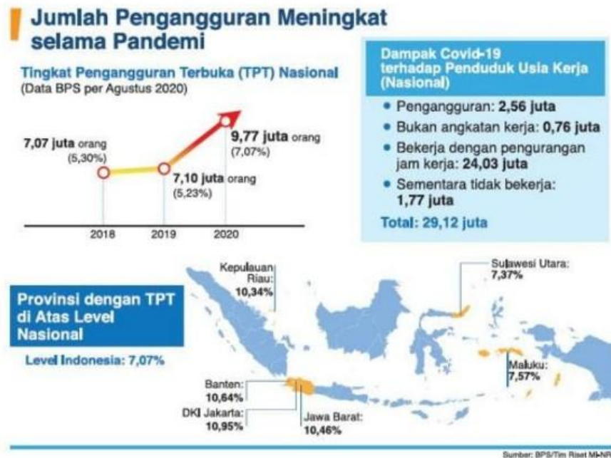
Gambar 1.2 Jumlah Pengangguran Selama Pandemi