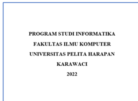
Gambar 1.1 Contoh Gambar Teks Berbentuk file .png dari Dokumen .docx