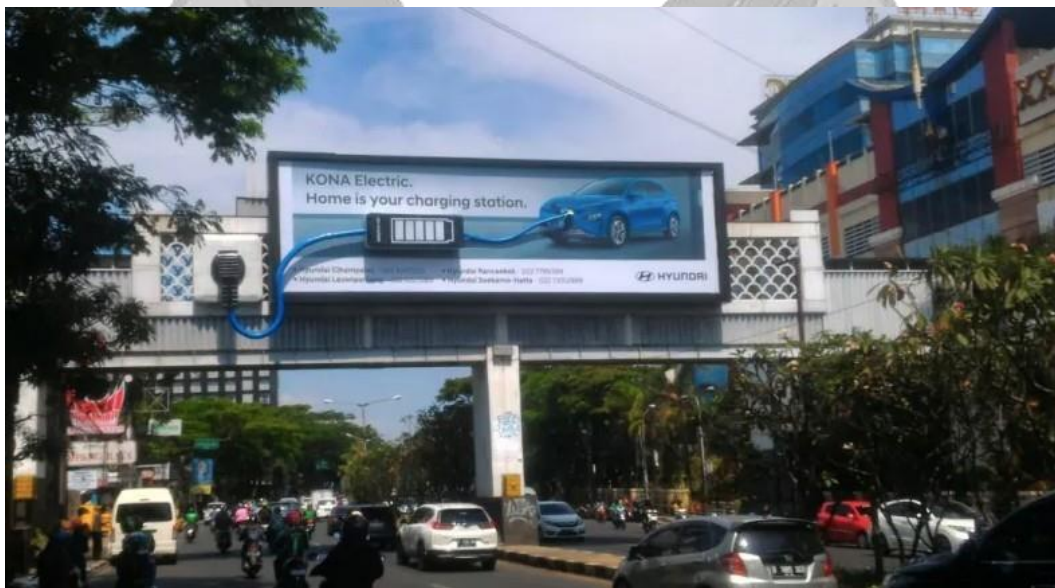
Gambar 1.1. Papan Billboard Hyundai Kona Electric

Kemudian, dapat dibuktikan juga bahwa PT Hyundai Motors Indonesia juga ikut serta dalam acara G20 yang akan di selenggarakan di Bali pada tahun 2022 dan kendaraan mobil berbasis listrik menjadi kendaraan resmi G20 Summit. Kemudian, Hyundai akan menyediakan kendaraan listrik untuk para delegasi antara lain Genesis Electrified G80 dan IONIQ 5. (Hyundai.com). Kemudian, PT Hyundai Motors Indonesia juga memasarkan produk kendaraan listrik mereka dengan menggunakan Papan Billboard yang ada di jalan setidaknya ada 100 titik papan billboard yang dipasang di seluruh Indonesia (Simanjuntak Uria, 2022).