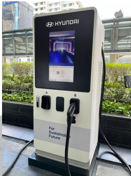
Gambar 1.4. Hyundai Resmikan fasilitas Ultra Fast Charging

Berdasarkan gambar-gambar di atas, dapat disimpulkan bahwa Strategi yang digunakan oleh PT Hyundai Motors Indonesia memberikan dampak yang cukup dalam memasarkan produk mereka agar masyarakat Indonesia beralih dari kendaraan konvensional menjadi kendaraan listrik.