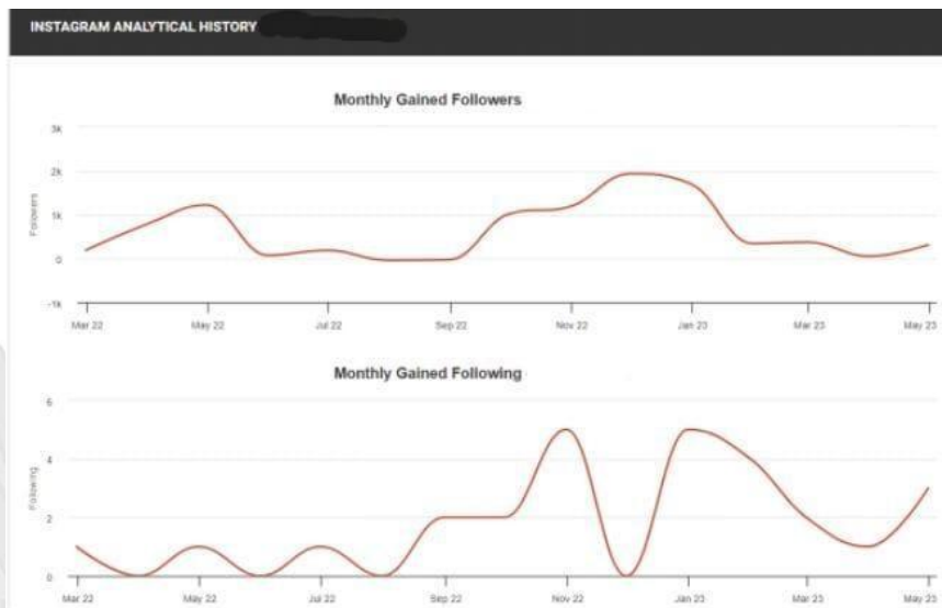
Gambar 1.3 Kinerja Instagram Tren Follower Aplikasi Telemedisin Rumah Sakit XYZ