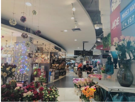
Gambar 1.3 Ace Hardware Cabang Royal Plaza Surabaya

Dalam gambar 1.3 di atas dapat dilihat bahwa Ace Hardware memiliki in-shop emotions yang membuat pelanggan nyaman dalam berbelanja, mulai dari penataan tempat yang rapih, pemilihan warna, keadaan dalam toko yang berbau sedap dan lain-lain sehingga pelanggan akan merasa senang dan nyaman saat berbelanja di Ace Hardware. Hal ini membuat suasana hati pelanggan dalam keadaan yang efektif untuk melakukan transaksi pembelian di Ace Hardware.