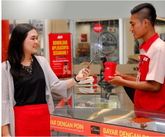
Gambar 1. 7 Interaksi Pelanggan dan Staff Ace Hardware

terdapat di sekitar mereka. Orang – orang disekitar konsumen tersebut bisa saja seperti pasangan, keluarga, teman dekat, dan bahkan tak terkecuali pendapat dari Sales Person/SPG yang berada di toko (media.neliti.com diunduh pada tanggal 25 Januari 2019).