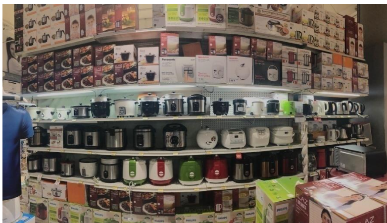
Gambar 1. 6 Ace Hardware Cabang Galaxy Mall Surabaya

Dapat dilihat pada gambar 1.5 dan gambar 1.6 satu produk Ace Hardware memiliki banyak pilihan dalam berbagai brand. Ace Hardware memiliki lebih dari 80.000 item barang dalam satu toko. Hal ini menjadikan Ace Hardware sebagai penyedia produk yang bermacam-macam. Ace Hardware menyediakan produk dalam 16 brand yang berbeda sehingga pelanggan dapat memilih sesuai dengan kebutuhan. (www.acehardware.co.id diunduh pada tanggal 25 Januari 2019).