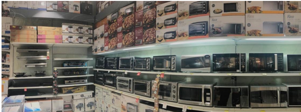
Gambar 1. 5 Ace Hardware Cabang BJ Junction

Merchandise variety menurut Mikell P. Groover (2018) dapat diartikan sebagai produk yang memiliki desain atau jenis yang berbeda dan diproduksi oleh perusahaan (sciencedirect.com diunduh pada tanggal 24 Januari 2019).