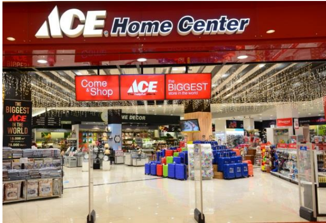
Gambar 1. 8 Tampilan Depan Gerai Ace Hardware

Sumber : www.acehardware.co.id diunduh pada tanggal 27 Januari 2019