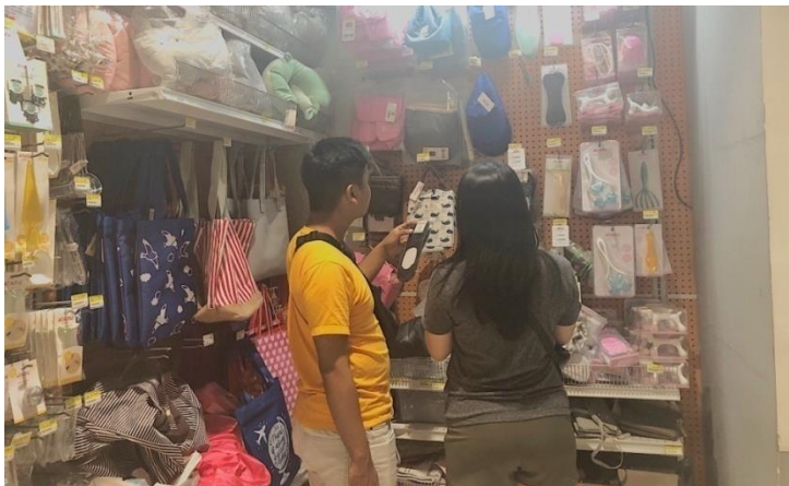
Gambar 1.4 Ace Hardware Cabang Tunjungan Plaza 1 Surabaya

Menurut Tombs dan McColl-Kennedy (2018) presence interaction other customers didefinisikan sebagai interaksi pelanggan-ke-pelanggan verbal yang mengambil peran pelengkap atau pengganti untuk upaya penjualan, hal sangat berdampak pada kepuasan pelanggan dan persepsi layanan.