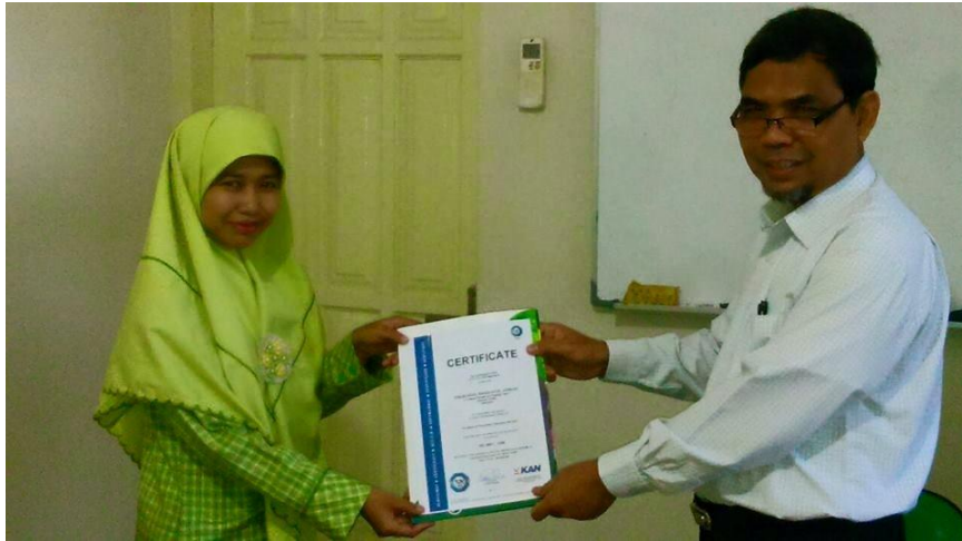
Gambar 1.6 Penyerahan Sertifikat ISO