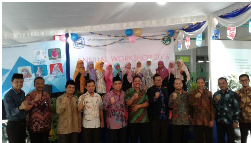
Gambar 1.5. Kegiatan Workshop Pendidik

Pada organisasi pembelajaran ( learning organization ) organisasi tidak hanya belajar dari kegagalan, melainkan juga belajar keberhasilan dari masa lampau. Bronner dan Delaney (1996). Danim (2005) mengemukakan organisasi yang belajar dari kegagalan dan keberhasilan masa lampau untuk memacu orang atau manusia pembelajar untuk mengerjakan pekerjaan atau tugas-tugas pembelajaran secara baik, kreatif, dan bermakna. Organisasi pembelajaran merupakan proses pengujian pengalaman secara terus-menerus dan perubahan pengalaman itu menjadi pengetahuan yang dapat diakses oleh seluruh anggota organisasi dan relevan dengan tujuan utamanya. Organisasi pembelajaran menjelaskan lingkungan pembelajaran, pembelajaran potensi kerja dan lingkungan pembelajaran dalam konteks kerja (Poell, Dam, & Berg, 2004).