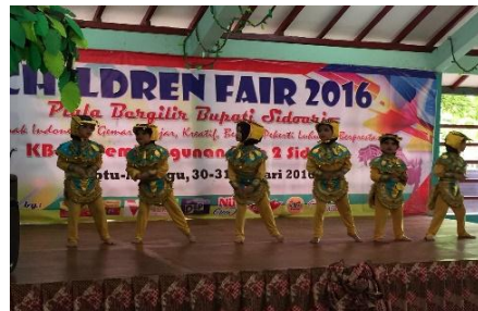
Pertunjukan oleh anak anak