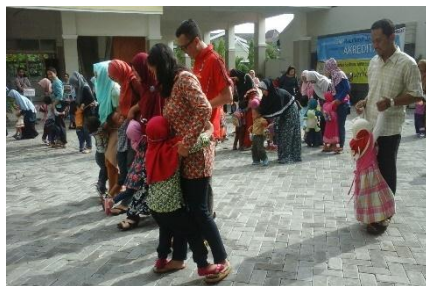
Kegiatan bersama wali murid