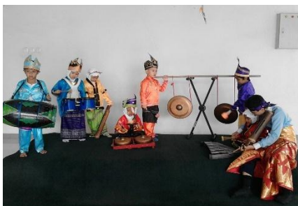
Kegiatan bermain musik