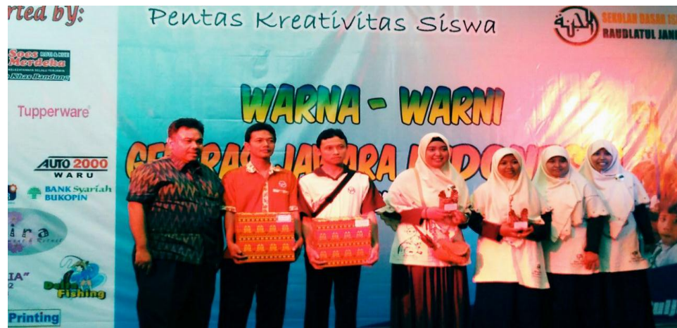
Gambar 1.4. Penghargaan bagi Pendidik Raudlatul Jannah