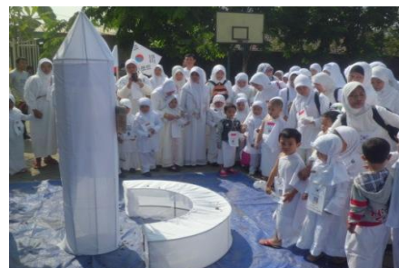
Kegiatan latihan keagamaan