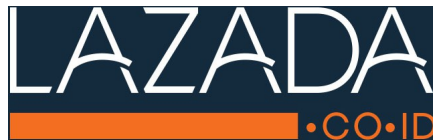
Gambar 1.4 Logo Lazada Indonesia

dengan jumlah karyawan hanya 4 orang di tahun awal berdiri. Saat ini Lazada telah didukung oleh 1.500 karyawan dan sekitar 2.000 pelapak (marketeers.com diunduh tanggal 23 Mei 2016). Lazada hadir dengan menawarkan pengalaman belanja tercepat, aman dan nyaman dengan beragam kategori produk mulai dari fashion , peralatan elektronik, peralatan rumah tangga, kesehatan & kecantikan, mainan anak-anak dan peralatan olahraga ( www.lazada.co.id ). Tercatat ada 13 macam kategori produk di katalog website Lazada. Pada akhir 2015 Lazada merilis produk yang memiliki daya tarik kuat di website mereka, yaitu peralatan elektronik merek Samsung dan Asus serta produk kesehatan & kecantikan merek Ponds ( www.jawapos.com/lazada-rilis-produk-yang-paling-banyak-dicari diunduh tanggal 24 Mei 2016).