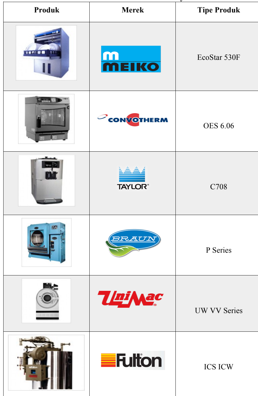
Tabel 1.1 Produk PT Mastrada Surya

mereka dan dijual pada bisnis konsumen di Indonesia. PT Mastrada Surya memiliki 4 divisi namun yang menjadi pedoman pesan market seperti dalam tabel 1.1. (Sumber : wawancara dengan PT Mastrada Surya, 2015)