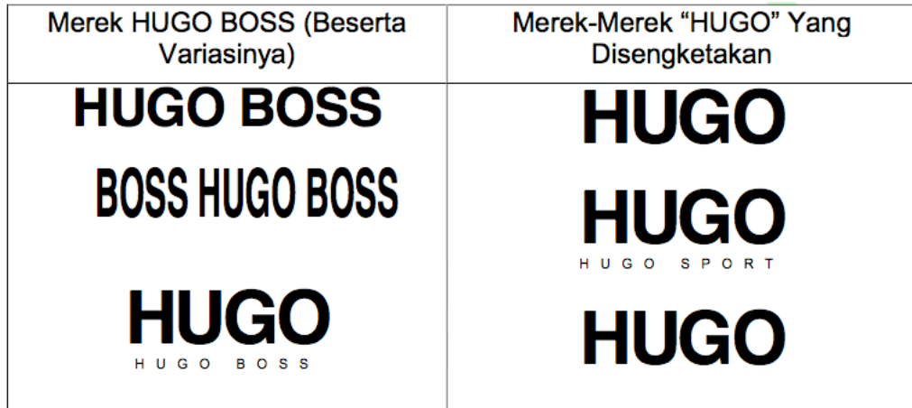
Gambar Lampiran I