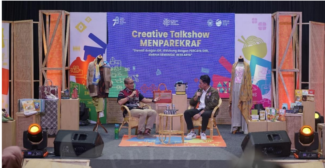
Gambar 1. 1 Dokumentasi kegiatan Apresiasi Kreasi Indonesia

Pameran AKI adalah salah bentuk pasar dimana terjadi pertemuan antara pelaku kreatif sebagai produsen dan pengunjung sebagai konsumen. Pendukung yang dilakukan untuk meningkatkan kualitas pameran AKI adalah dengan memberikan pelatihan terlebih dulu bagi para pelaku kreatif dalam bentuk bootcamp sebagai edukasi bagi para peserta untuk meningkatkan kualitas dari usaha mereka (Kementerian Pariwisata dan Ekonomi Kreatif, 2023b). Salah satu materi yang diberikan di tahap bootcamp adalah tentang strategi pemasaran dan perilaku konsumen dalam membuat keputusan pembelian (Kementerian Pariwisata dan Ekonomi Kreatif, 2023a).