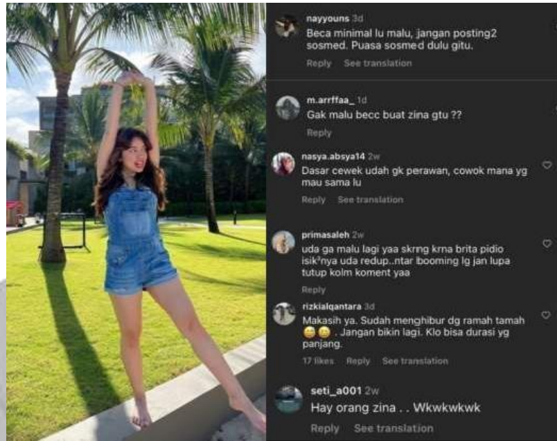
Gambar 1.1 (@rklopperr)

Oleh sebab itu teknologi pada jaman sekarang dapat dijadikan platform untuk memberikan cacian atau hinaan kepada seseorang tanpa tau kebenarannya sehingga etika komunikasi pada masyarakat di media sosial ini semakin menurun.