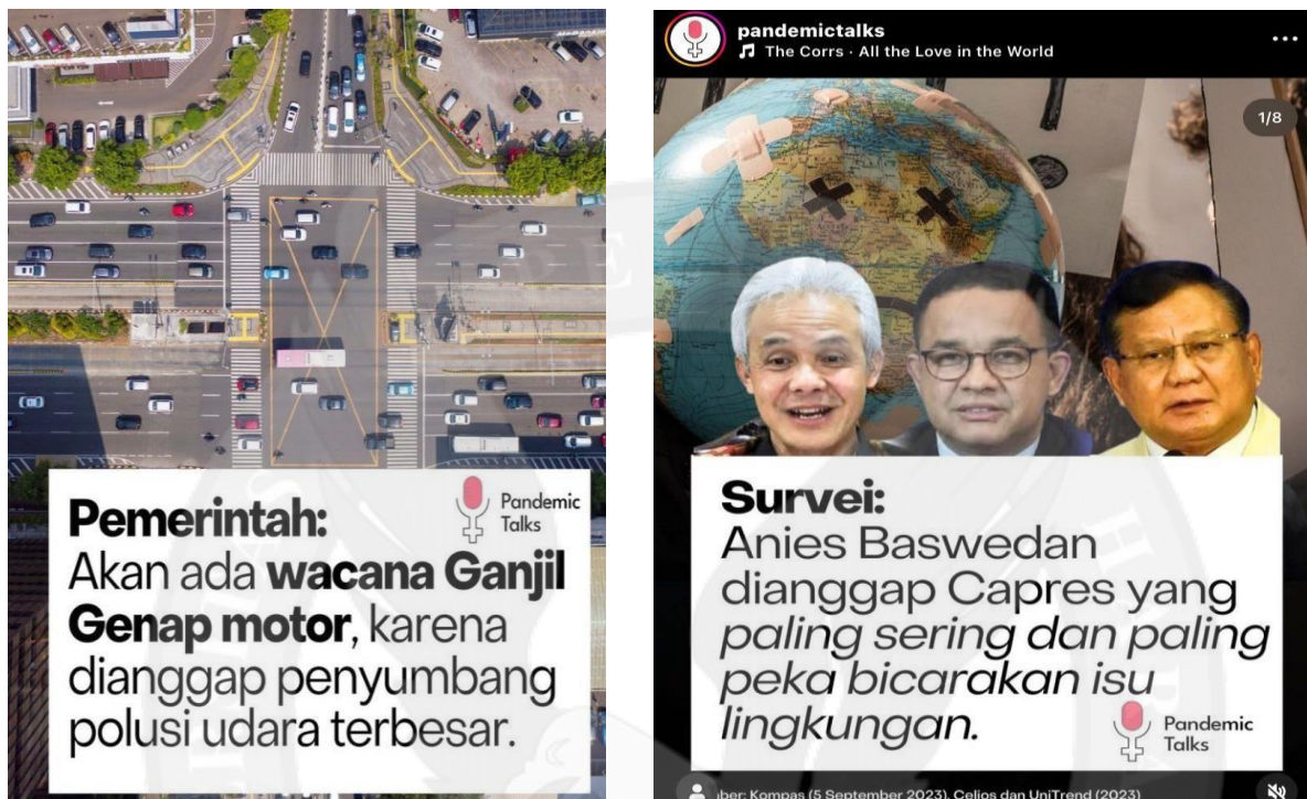
Gambar 1.2 Konten di Instagram @pandemictalks

@pandemictalks ternyata setelah di amati akun ini tidak hanya punya Instagram melainkan mereka mempunyai tiktok dan podcast, semakin berkembang akun ini konten yang di posting tidak hanya informasi mengenai Covid 19 saja melainkan banyak informasi yang di sampaikan contohnya saja terkait dengan cuaca yang sedang extreme, politik serta masalah sosial lainnya.