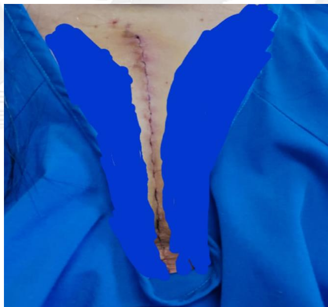
Gambar 1.j “Foto Dokumentasi Pasca Operasi Juliati Simanullang”

Penulis tertarik untuk menelitinya dan memberi judul “Tanggung Jawab Non Litigasi Perusahaan Asuransi Jiwa terhadap Penyelesaian Sengketa atas Klausula Perjanjian Pengecualian Polis dalam Perspektif Keadilan Bermartabat” . Penulis meyakini sepenuhnya bahwa setiap manusia memiliki hak yang sama yang tertuang dalam pasal 28D ayat (1) UUD 1945 di katakan, bahwa “setiap orang berhak atas pengakuan, jaminan, perlindungan, dan kepastian hukum yang adil serta perlakuan yang sama di hadapan hukum”. Penulis mengucap syukur kepada Tuhan Yesus, mulai dari penolakan hingga proses permohonan pembatalan klausula perjanjian pengecualian polis dan proses akhir penyelesaian sengketa ini, akhirnya Juliati Simanullang bisa menjalani operasi hingga ke luar negeri ditangani oleh dokter yang terkenal dengan pertolongan jaminan biaya pengobatan dari perusahaan asuransi jiwa. Semoga Tuhan selalu memberi kesehatan kepada Juliati Simanullang yang merupakan isteri tercinta penulis yang sudah dikarunia 2 orang anak.