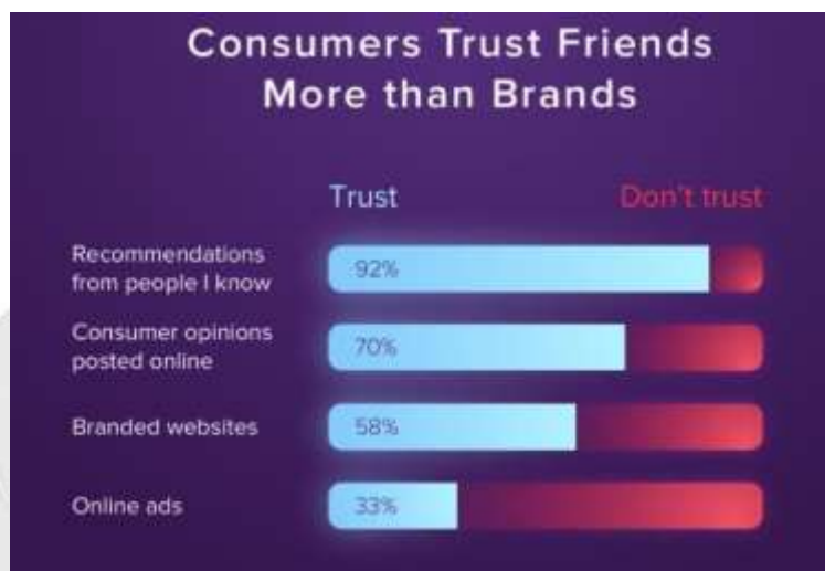
Gambar 1.2 Tingkat Kepercayaan Konsumen dari Rekomendasi Teman

Berdasarkan gambar 1.2, sebuah survei yang dilakukan oleh marketing platform internasional yaitu Tint menunjukkan bahwa 92% konsumen lebih mempercayai rekomendasi dari teman atau konsumen lain dibandingkan dengan iklan atau informasi yang diberikan perusahaan itu sendiri. Sementara opini konsumen yang diposting secara online dipercaya oleh 70% konsumen. Situs web resmi merek hanya dipercaya oleh 58% konsumen, dan iklan online mendapatkan kepercayaan dari 33% konsumen (Tint, 2019). Hal ini menunjukkan bahwa Word-of-Mouth merupakan hal yang cukup penting untuk diperhatikan. Word-of-Mouth (WOM) merupakan salah satu strategi pemasaran yang efektif untuk mengurangi biaya promosi dan alur distribusi perusahaan (Setiawan dan Suriyanto, 2022).