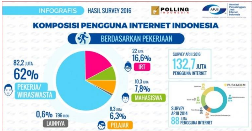
Gambar 1.3 Komposisi Pengguna Internet Indonesia Berdasarkan Pekerjaan

juta atau 16,6%. Seperti yang digambarkan pada gambar berikut (Isparmo, 2016):