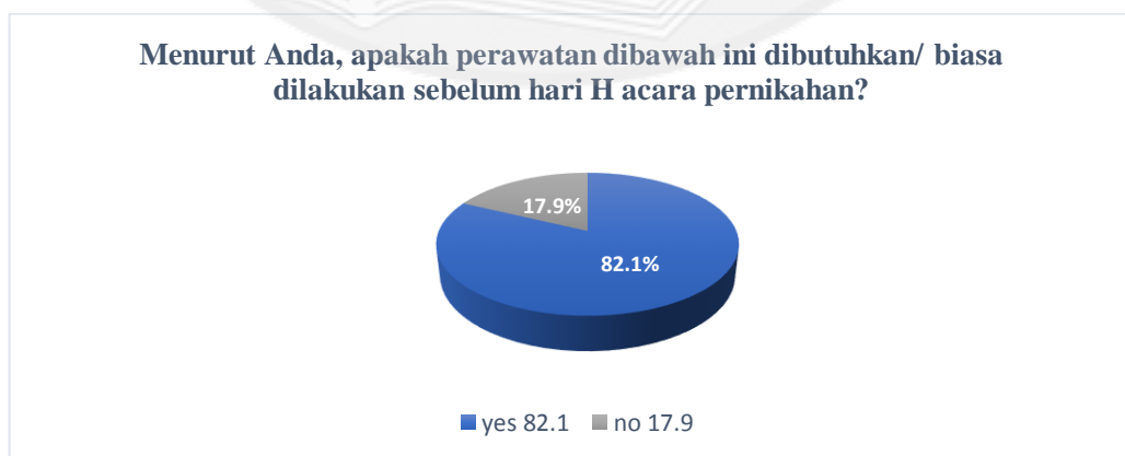
Gambar 1.2 Diagram Data Hasil Kuesioner Kebutuhan Pasar

Adapun nilai tambah yang diberikan tersebut didapatkan dari hasil kuesiner yang telah disebar secara online sehingga menghasilkan 212 responden, di mana terdapat 175 responden yang menyetujui tentang dibutuhkannya perawatan tersebut untuk calon pengantin. Berikut diagram data hasil kuesioner kebutuhan pasar yang telah didapat.