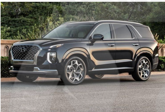
Gambar 1.2: Hyundai Logo dan Mobil Hyundai.

telah menyumbang 13,52 persen dari total penjualan dengan tetap mengikuti kebijakan “Low-Cost Green Car” (LCGC) dari pemerintah. Meningkatnya permintaan mobil menyebabkan persaingan yang ketat antar produsen mobil di Indonesia, dimana sebagian besar pangsa pasar masih didominasi oleh produsen mobil asal Jepang. Oleh karena itu salah satu perusahaan retail otomotif ternama asal Korea, Hyundai Motors juga berkontribusi memasuki pasar Indonesia dan ingin ikut bersaing dengan produsen lainnya.