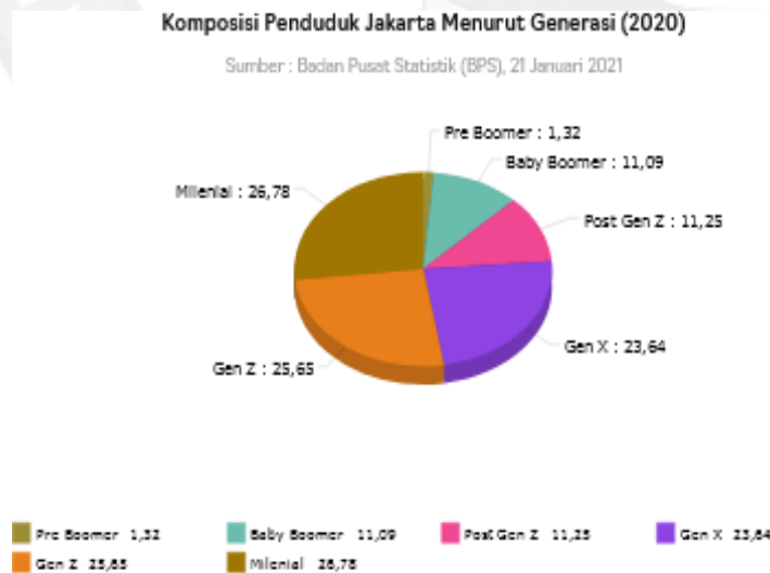
GAMBAR 4 Komposisi Penduduk Menurut Generasi (2020)