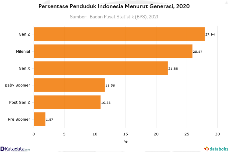
GAMBAR 3 Persentase Penduduk Indonesia Menurut Generasi

GIOI memiliki rating 4.6/5 serta Monsieur Spoon memiliki rating 4.5/5. Oleh sebab itu, peneliti tertarik meneliti restoran tersebut karena selain sedang trending di kalangan milenial, keempat restoran tersebut juga memiliki nilai rating yang bagus.