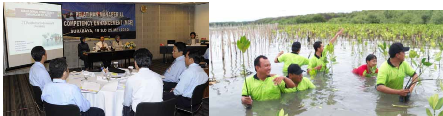
Program pendidikan dan pelatihan