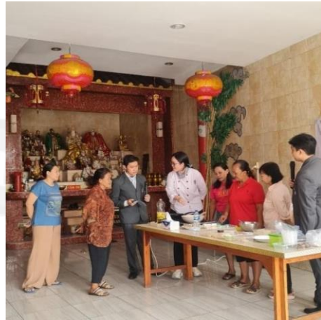
LAMPIRAN 2 Pelaksanaan Demonstrasi Masak