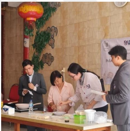
LAMPIRAN 3 Pelaksanaan Demonstrasi Masak