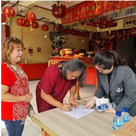
LAMPIRAN 1 Peserta melakukan registrasi