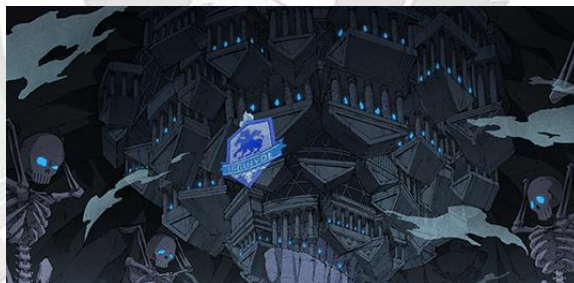
Gambar 1.2 Desain latar asrama Ignihyde yang terinspirasi oleh konsep neraka dalam mitologi Yunani

muda, karena para antagonis digambarkan sebagai karakter-karakter atraktif yang seumuran dengan mereka, dengan masalah pribadi yang manusiawi. Bukan hanya secara psikologis, namun game ini juga membangkitkan minat pemain terhadap daerah asal cerita rakyat tersebut, dengan cara menginkorporasikan elemen-elemen budaya tersebut dalam desain karakter, latar, dunia, dan juga karakterisasi yang dicampur dengan elemen-elemen fantasi dan modern. Akan tetapi, seperti yang telah disebutkan sebelumnya jarang ada media yang mengangkat cerita rakyat dan budaya Indonesia dalam outlet video game . Hal ini sangat disayangkan karena Indonesia memiliki banyak cerita rakyat yang menarik, dan masing-masing cerita tersebut juga memiliki nilai moral yang berharga dan dibutuhkan dalam kehidupan nyata. Dengan mengemas cerita tersebut dengan berkembangnya zaman, hal ini akan meningkatkan minat anak bangsa terhadap cerita rakyat.