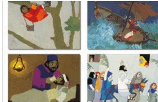
Gambar 1.1 Ilustrasi Kees de Kort

dengan kegiatan sehari-hari mereka yang dapat diidentifikasi melalui latar tempat, properti, pakaian, dan lain-lain.